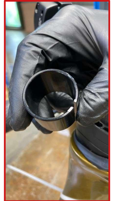
アルミ製シム 自主回収/リコール対象